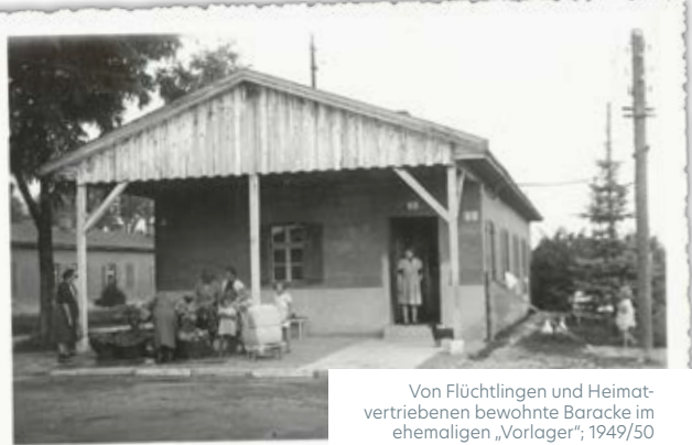
Von Flüchtlingen und Heimatvertriebenen bewohnte Baracke im ehemaligen „Vorlager“; 1949/50