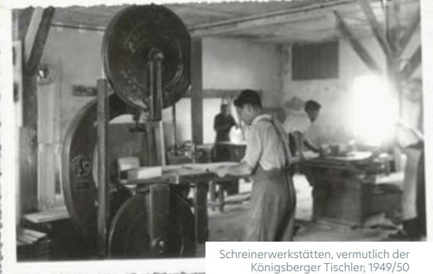
Schreinerwerkstätten, vermutlich der Königsberger Tischler; 1949/50